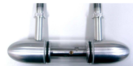
Bild 6: Detektionskörper für ein Förderrohr mit 150 mm Durchmesser.