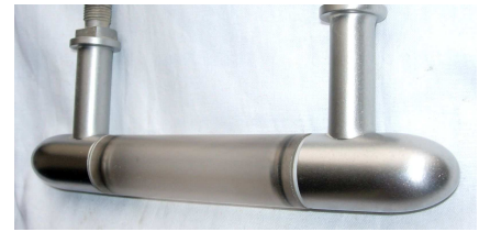
Bild 3: Der Detektionskörper bleibt auch nach Dauerbetrieb frei von Ablagerungen und zeigt kaum Abnutzung.

Zur Zeit wird daran gearbeitet, das System zur Marktreife zu führen, wobei drei Aufgabenfelder parallel bearbeitet werden. Zum einen ist ein Detektionskörper in einer Mühle eingebaut, um sein Verschleißverhalten zu untersuchen. Bisher, d. h. nach einem \frac{3}{4} Jahr Standzeit, zeigt der Körper nur wenig Abnutzungserscheinungen. Zum zweiten werden weitere Tests des Systems durchgeführt, wobei größere Rohrweiten und Varianten des Detektionskörpers zum Einsatz kommen. Zum Dritten wird die Elektronik des Systems weiterentwickelt. Die bisher verwendete analoge Schalttechnik wird durch programmierbare Mikrocontroller ersetzt, die eine intelligente und flexible Signalauswertung ermöglichen. So kann das Auftreten von Fehlauflösungen des Systems unterbunden werden.