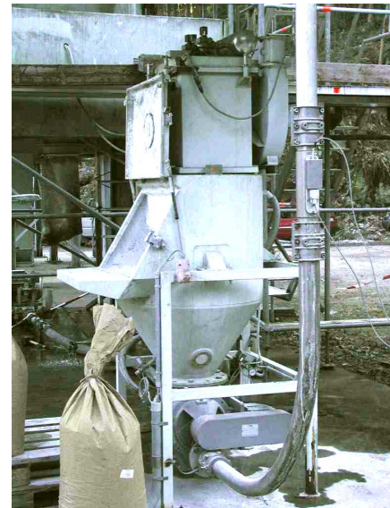
Bild 4: Praxisnahe Tests des Systems auf dem Versuchsgelände der BGN/FSA.